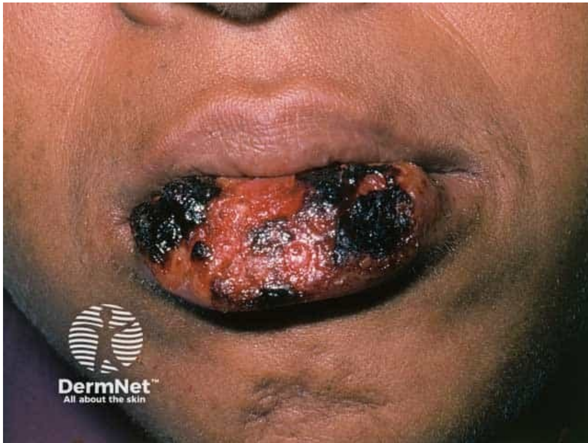
Atypisk herpes simplex