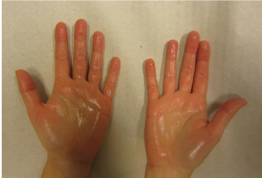
Bild med tillåtelse av patient från Norrlands universitetssjukhus, Umeå