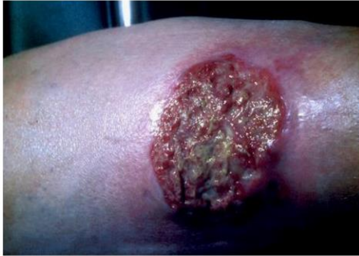
Bild 11 och 12. Atypiskt sår: Pyoderma gangraenosum. Mörjig smärtsam progredierande sårbildning med underminerad, rödcyanotisk sårkant.