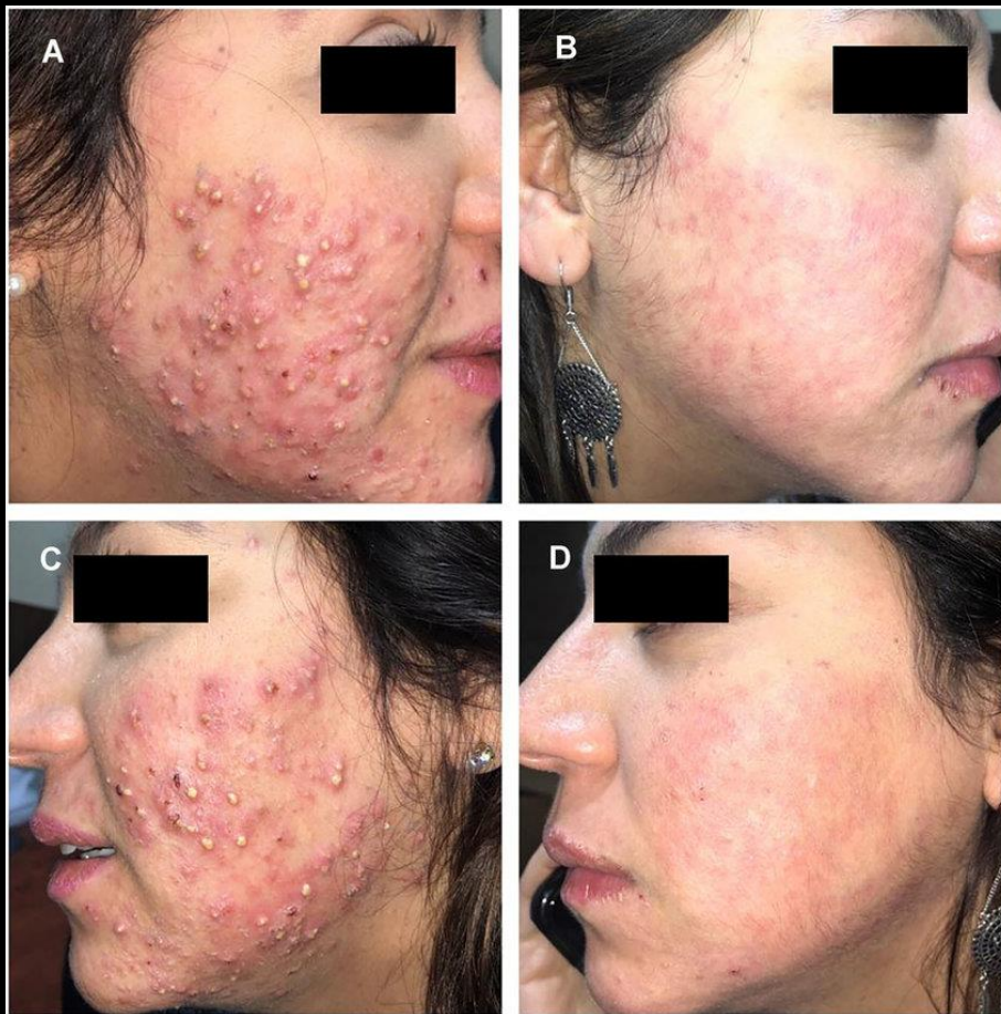
(A, C) baseline, with severe papulopustular lesions. (B, D) six months after treatment