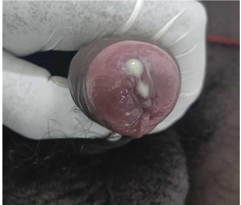
Källa: Shatikkulamin H, Shajil C. Acute gonococcal urethritis. IDCases. 2024;39:e02130. CC BY-NC-ND.