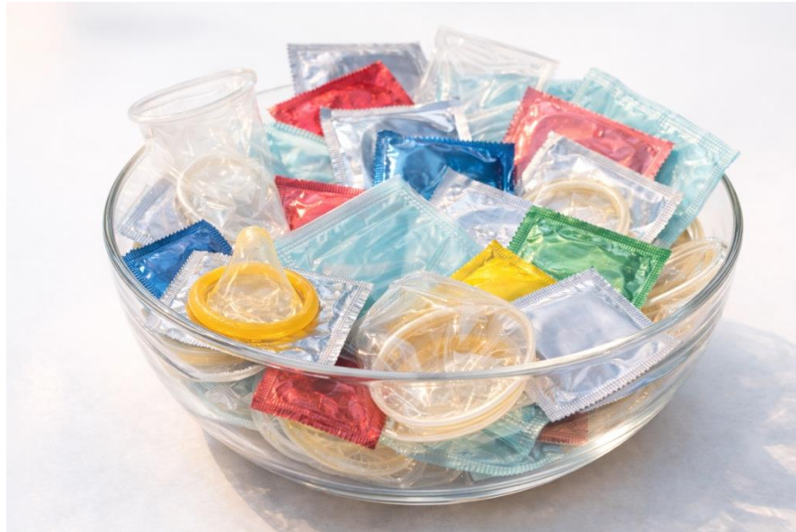
Illustration skapad med ChatGPT